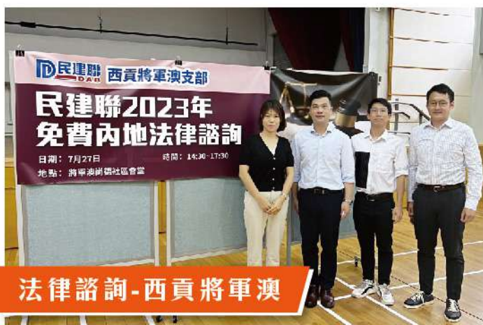
法律諮詢-西貢將軍澳