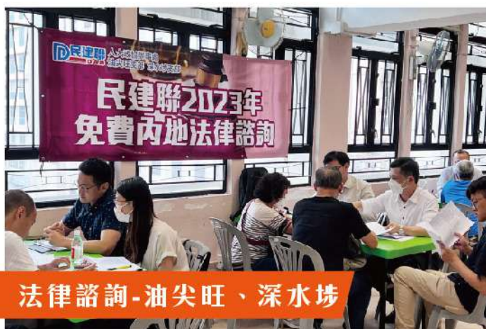
法律諮詢-油尖旺、深水埗